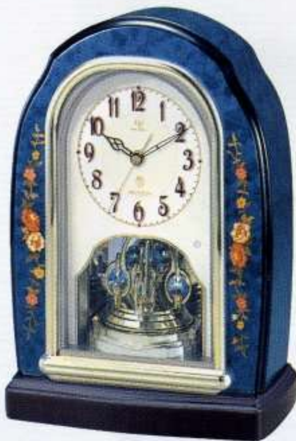
04 青象嵌仕上(アイボリー)