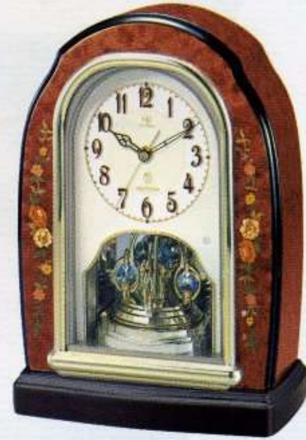
06 茶色象嵌仕上(アイボリー)