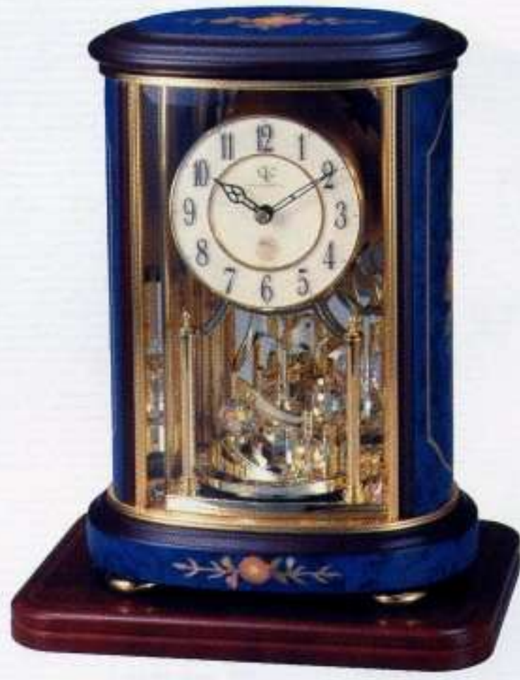
04 青象嵌仕上(アイボリー) NEW