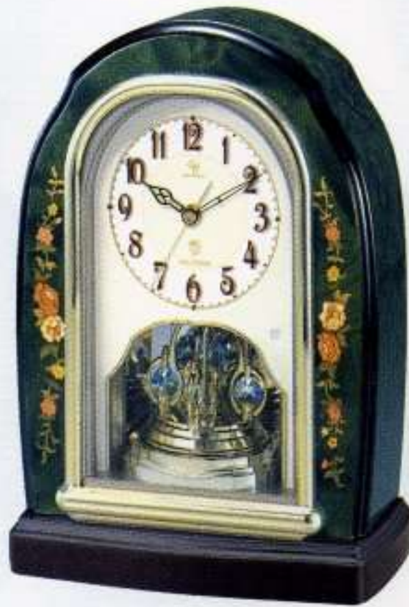
05 緑象嵌仕上(アイボリー)