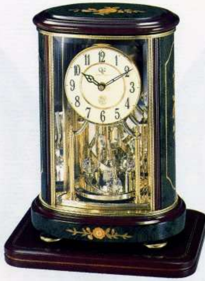
05 緑象嵌仕上(アイボリー)