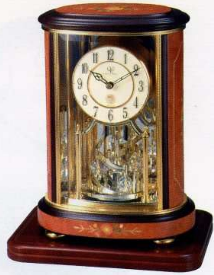
06 茶色象嵌仕上(アイボリー) NEW